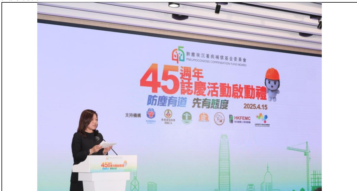
圖一：主禮嘉賓勞工處處長陳穎韶女士，JP 致歡迎辭。